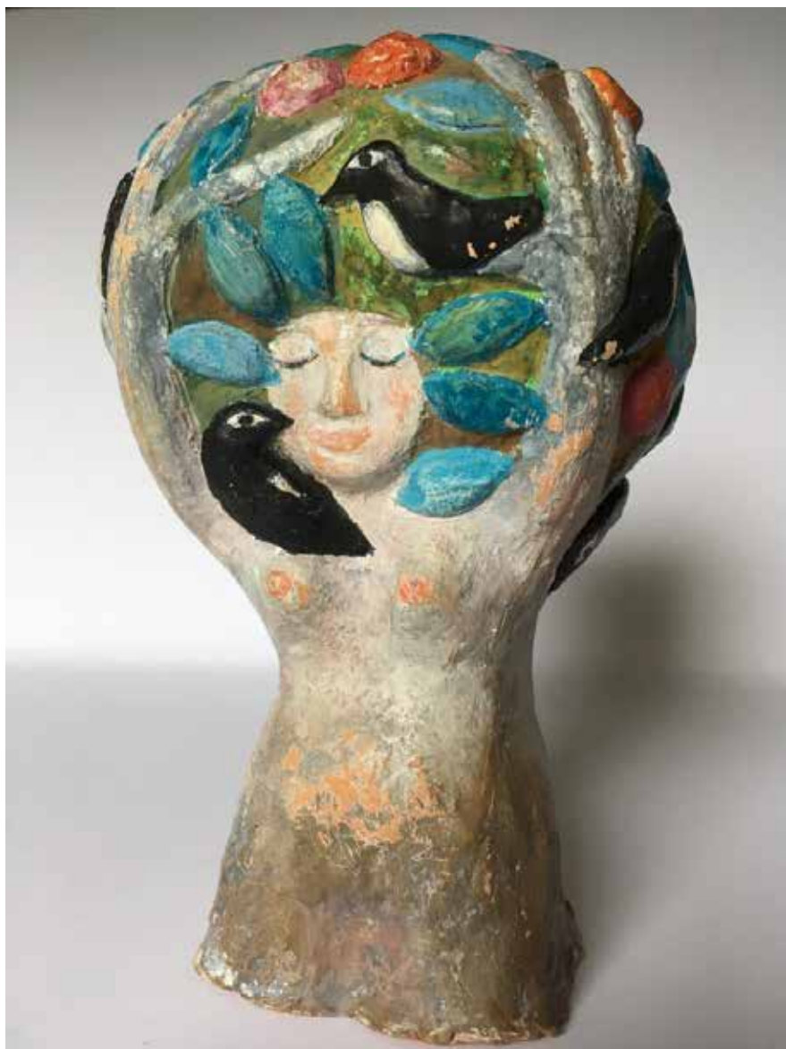
Dafne i litet format, en terrakottaskulptur utförd redan 1947.

– Med det dubbelseendet handlar det för mig som författare inte längre om att utreda och klämma in allt material i en konventionell biografi utan att följa en väg där man ser