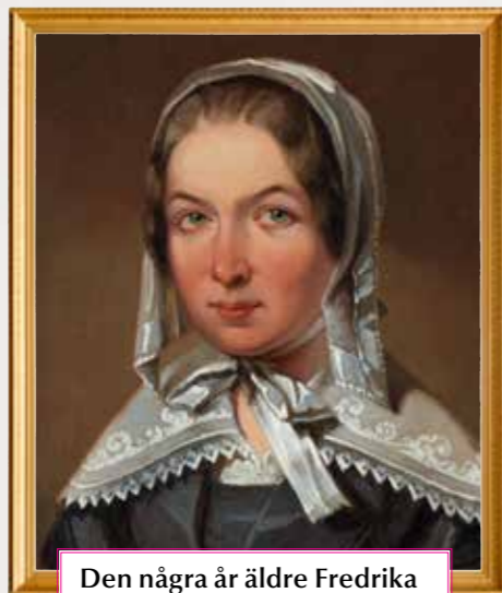
Den några år äldre Fredrika Bremer var en av väninnorna i hennes umgängeskrets.